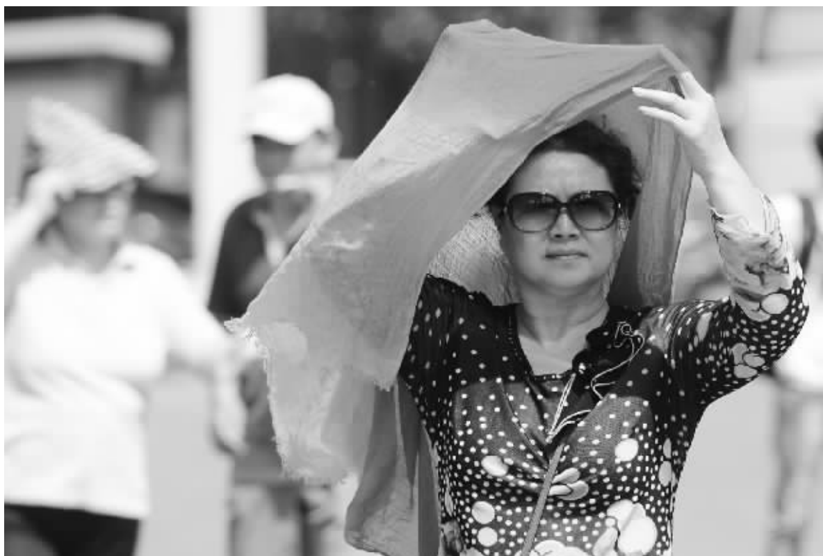
昨日沈阳故宫附近,行人用围巾抵挡高温和大风

不过,气象部门提醒公众,对于这种“热得猝不及防”的天气过程,更需做好防暑降温措施,尤其对老人、孩童和体弱者,