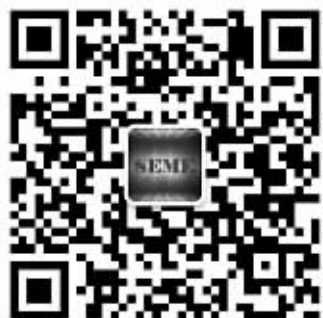
关注学校微信平台，便捷在线咨询报名

根据辽财教[2013]499号文件，农村、城市低保(凭证)和城市低保边缘户(凭证)家庭学生均享受国家助学金资助，国家资助两年，2000元/年/生。