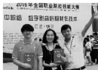
2016年全国职业院校技能大赛金牌选手及指导教师

实现招生计划提前完成，并在部分专业开始实施入学面试工作，确保生源质量。近5年近千名学生考入本科院校，按报考统计升学率达90%以上。由于办学特色鲜明，社会影响力强，就业率始终保持在99%以上，提供就业岗位达150%左右。