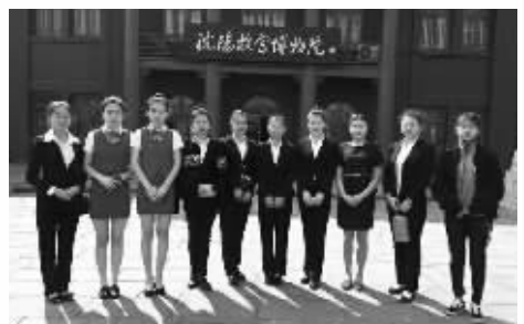
毕业生就业于沈阳故宫