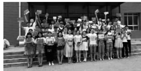
升入高等院校的毕业生