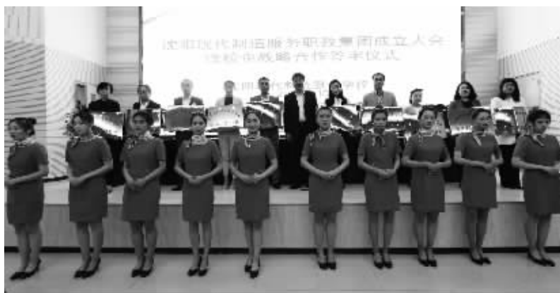
沈阳现代制造服务职教集团成立