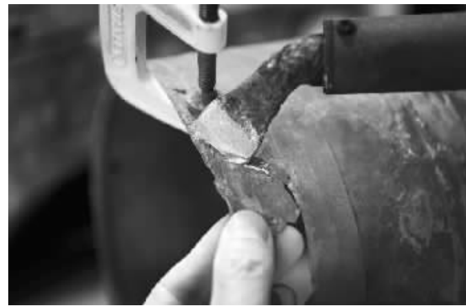
工作人员在对铜壶进行焊接