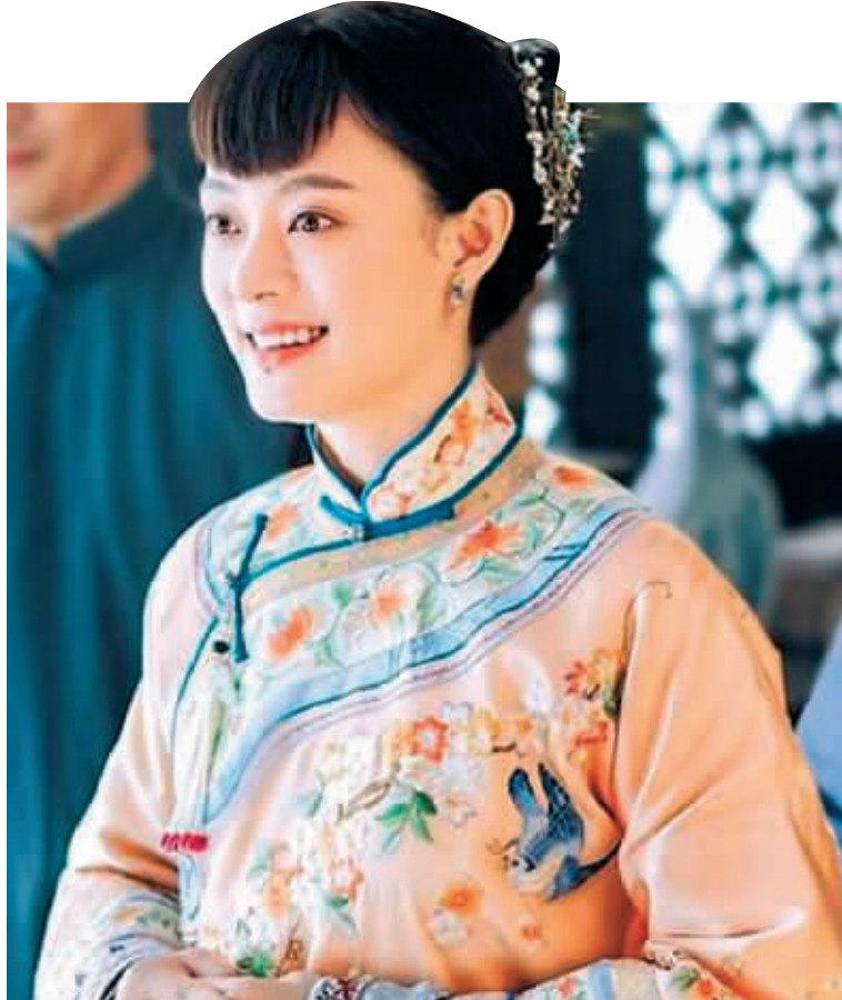
《那年花开月正圆》剧照