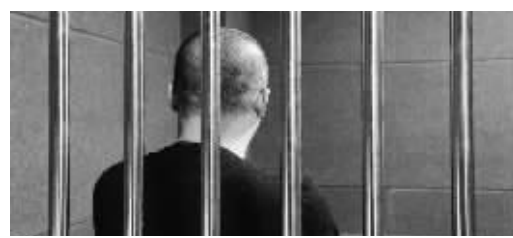
嫌疑人于某被警方抓获

本报讯(华商晨报记者 杨兴)以帮别人孩子办理军校生名额为名,他涉嫌诈骗10万元,被列为网上逃犯。然而,这名网逃竟然还在沈阳开了网约车司机,并且在马路上还依次等候通行,被交警当场拦截,随即网逃身份败露。然而当司机却表示,自己根本不知道咋回事。