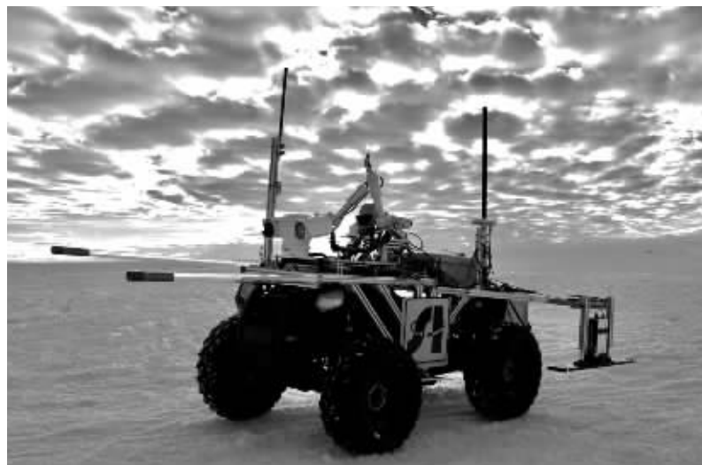
冰结构探测机器人在南极科考中实现探路应用

本项试验的成功,结合航空雷达和遥感照相宏观冰裂隙探测方法,为在未知冰盖区域建立安全运输路线提供了成功安全有效的技术保障和手段。