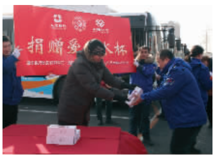
为客运驾驶员发放水杯

2018年3月15日 第二批捐赠物资，即2000个暖心水杯、23200个坐垫到位。（后由于天气转暖，坐垫回收待天气寒冷时再次发放）