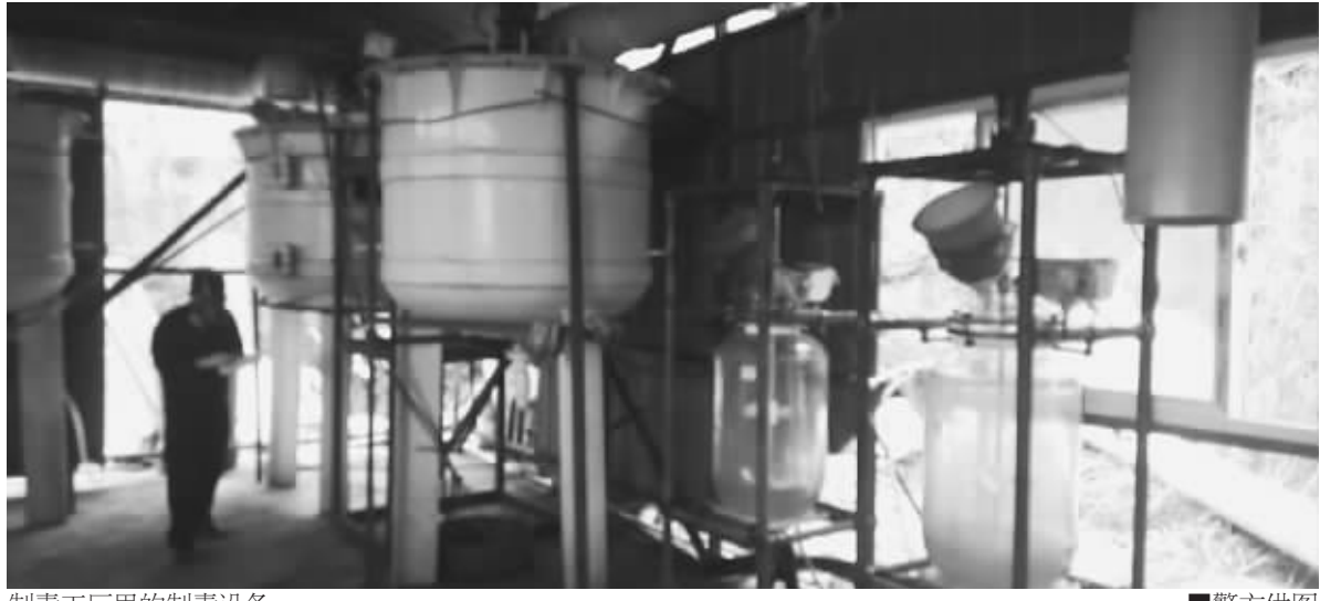
制毒工厂里的制毒设备