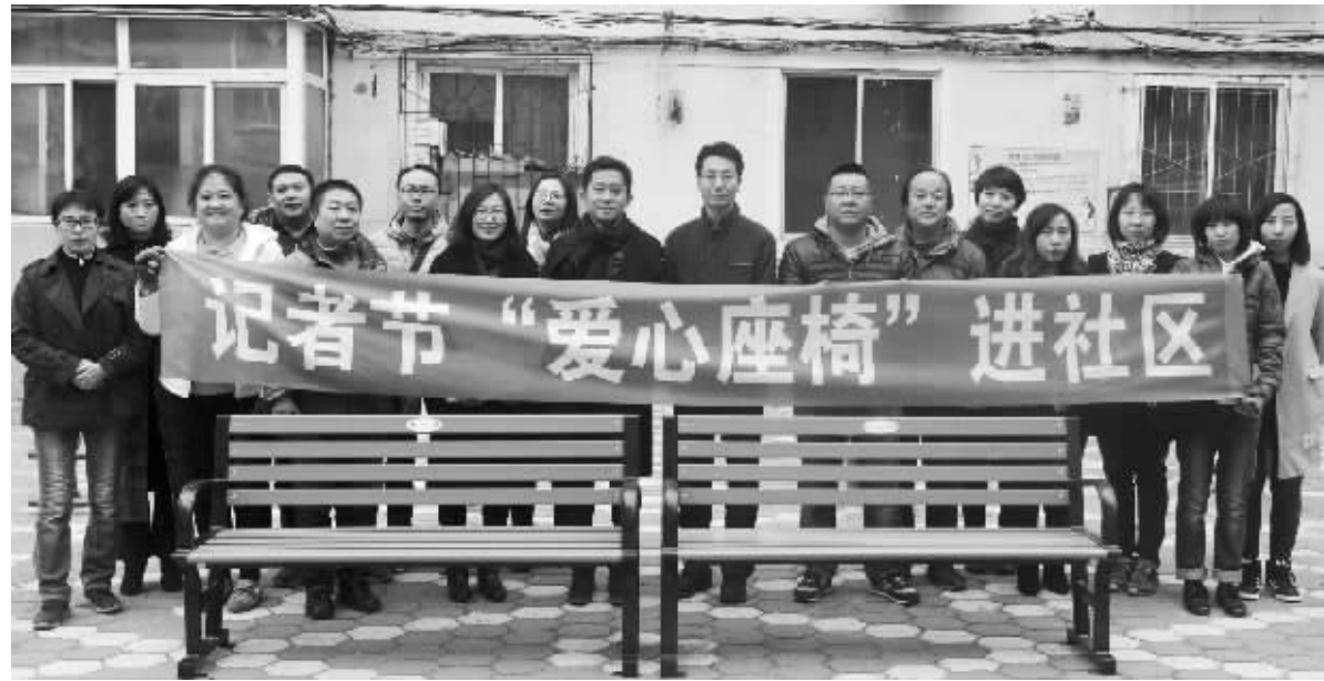
本报明星记者、编辑进社区安“爱心座椅”