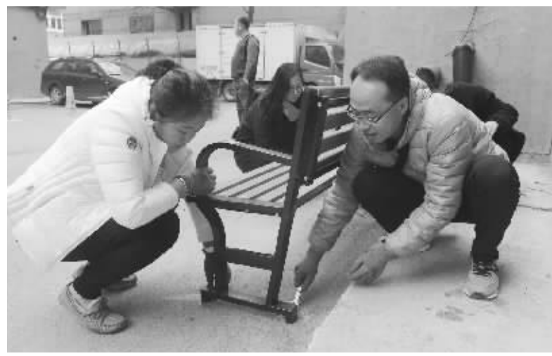
经过安装师傅指点,整个安装过程十分顺利

记者编辑,此时拿着电钻,抡起锤子,转动扳手,干劲十足地为社区安装了24把“暖心长椅”。