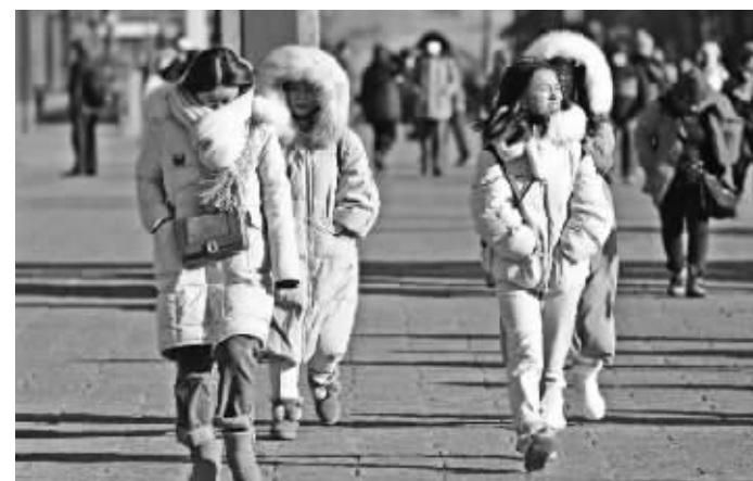
12月28日,沈阳天气依然挺冷,元旦期间将升温

12月30-31日,最低气温抚顺地区及西丰、建平为-22~-20℃,沈阳、本溪、阜新地区及铁岭市区、开原、昌图-20~-15℃,大连地区为-10~-5℃,其他地区为-15~-10℃;最高气温沈阳、抚顺、本溪、铁岭地区为-10~-7℃,其他地区为-7~-4℃。1月1日,最低气温沈阳、抚顺、本溪、阜新、铁岭、朝阳地区为-18~-14℃,大连地区为-9~-3℃,其他地区为-14~-9℃;最高气温沈阳、抚顺、本溪、铁岭地区为-8~-5℃,其他地区为-5~0℃。